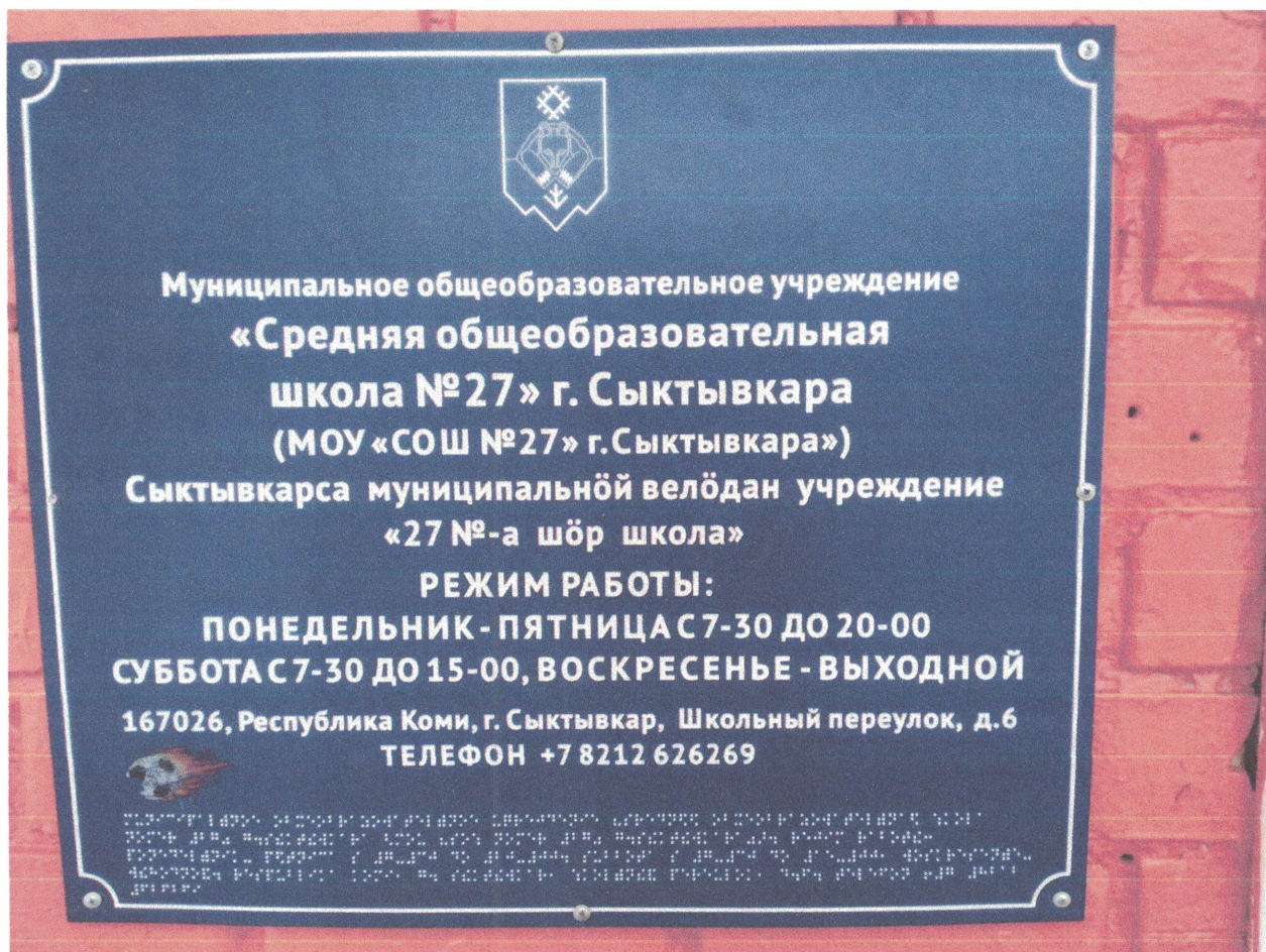
Фото №3. Табличка на входе в здание школы выполненная шрифтом Брайля.