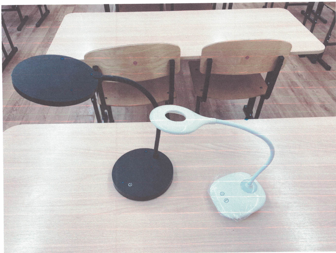
Фото №1. Настольных светильника (дополнительный источник света для слабо видящих).

Приложение к акту выполненных работ по адаптации объекта и повышению уровня доступности образования для людей с инвалидностью и маломобильным группам населения (МГН) в период с 2018 по 2022 годы к паспорту доступности ОСИ № 96 от 21.05.2018 года